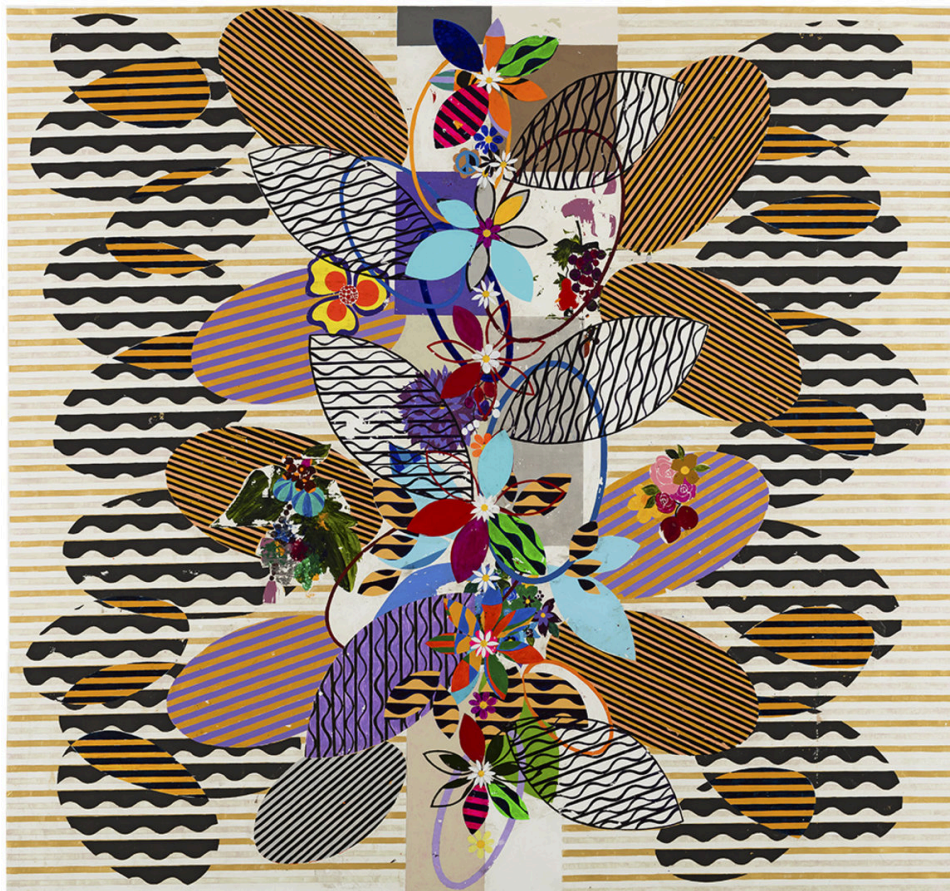
Obra de Beatriz Milhazes