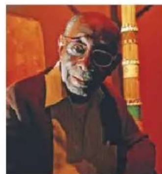
Mestre Didi, 2009.

Mestre Didi (1917-2013) foi escultor e escritor baiano, expoente da arte de matriz iorubá no Brasil.