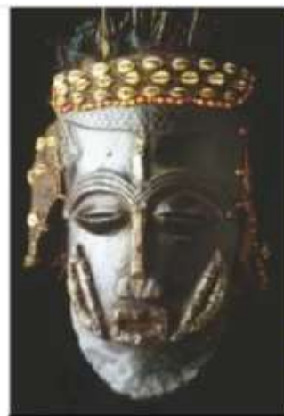
Máscara tradicional em ferro. Sua confecção é atual. Cultura conga, Zaire.

Nimi-a-Lukeni recebeu o título de manicongo (senhor do Congo) e passou a ser considerado o herói fundador do Reino do Congo. Depois, edificou seu palácio em Mbanza Congo e, a partir desse centro de poder, o Reino do Congo passou a controlar um amplo território. Na capital, o manicongo exercia sua autoridade com o auxílio de 12 conselheiros, entre os quais estavam os secretários reais, os oficiais militares, os homens da lei e os coletores de impostos, entre outros. Desses 12 conselheiros, quatro eram mulheres e representavam o clã das avós do rei. Os congos conheciam técnicas apuradas de fusão do ferro. Segundo a tradição, o fundador do Reino do Congo era um rei ferreiro, por isso os trabalhos em ferro eram reservados aos nobres.