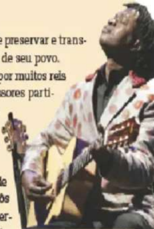
Baaba Maal, griô músico senegalês em apresentação na Grã-Bretanha, 2011.