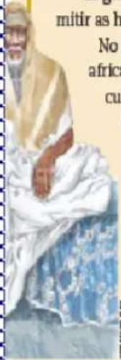
Ilustração representando um griô contador de histórias.

Além dos griôs contadores de histórias, havia também os griôs músicos e os cantores, que interpretavam e conservavam canções tradicionais; e havia, ainda, mulheres griôs, que faziam o mesmo que os griôs homens.