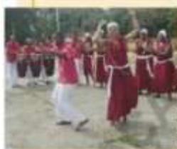
Apresentação do grupo Jongo de Figueira (SP), 2007.

Entre as manifestações culturais de raiz banta no Brasil está o jongo, canto e dança coletivos que contam com percussão de tambores e floresceu durante a expansão da cafeicultura no Vale do Paraíba fluminense e paulista. Em 2005, o jongo foi registrado pelo Instituto do Patrimônio Histórico e Artístico Nacional (Iphan) como Patrimônio Cultural Imaterial do Brasil. O jongo é praticado em todos os estados brasileiros da região Sudeste e é chamado também de cazambu.