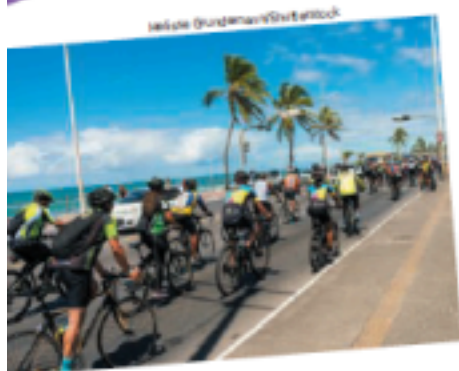
► Ciclistas pedalam no Dia Mundial sem Carro em Salvador (BA), 2019.

Leia o início de uma crônica de Antonio Prata.