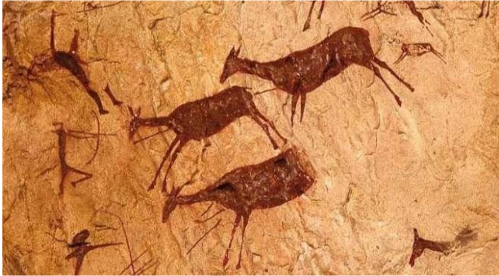
“Arte rupestre nas grutas de Lascaux, França”.

O Homem primitivo utilizava carvão, vegetais diversos, sangue e pelo de animais, dentre outras ferramentas para criar gravuras que representavam seu cotidiano (alimentação, rituais religiosos, relações sexuais, dentre outras atividades). As civilizações pré-históricas tinham a crença de que, ao representar algo na forma de arte rupestre, aquilo poderia vir a se materializar futuramente. Por exemplo: ao pintar uma situação de caça, seriam bem-sucedidos na próxima vez em que fossem caçar.